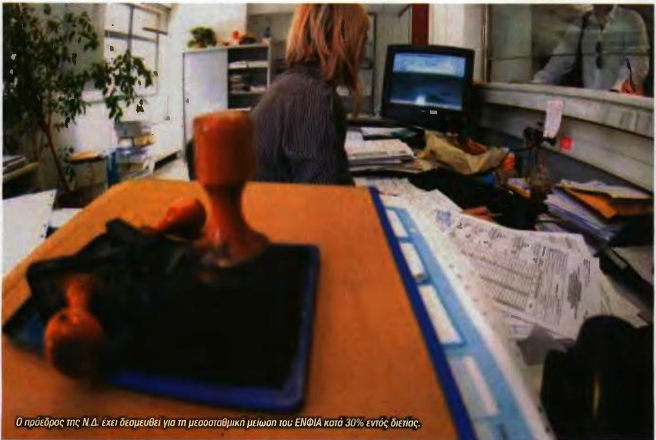
Ο πρόεδρος της Ν.Δ. έχει δεσμευθεί για τη μεσοσταθμική μείωση του ΕΝΦΙΑ κατά 30% εντός διετίας.

γία, να βελτιωθεί η εισπραξιμότητα στα ασφαλιστικά ταμεία και να μη χρειαστούν πρόσθετα μέτρα.