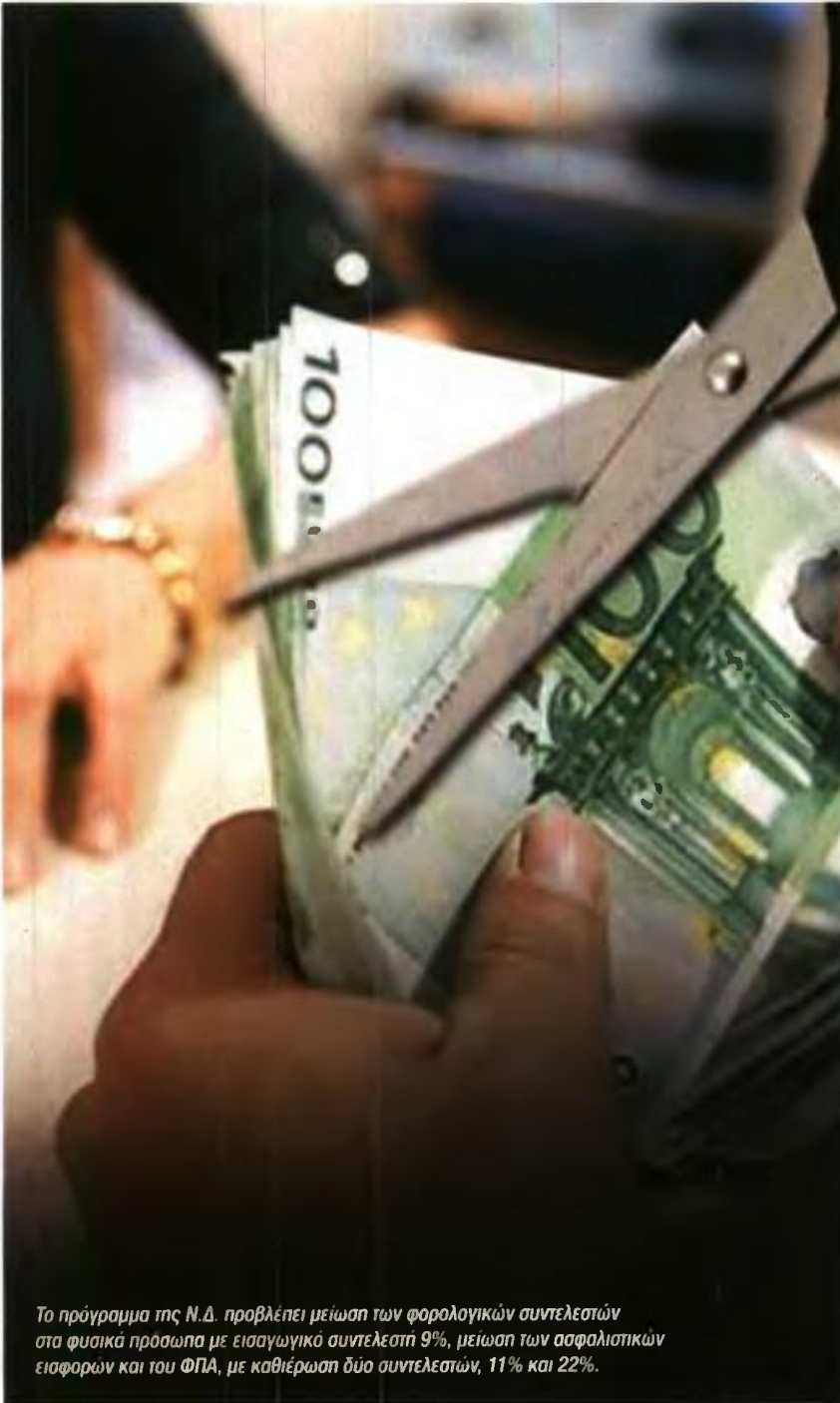
Το πρόγραμμα της Ν.Δ. προβλέπει μείωση των φορολογικών συντελεστών στα φυσικά πρόσωπα με εισαγωγικό συντελεστή 9%, μείωση των ασφαλιστικών εισφορών και του ΦΠΑ, με καθιέρωση δύο συντελεστών, 11% και 22%.

επενδύσεις και περισσότερες δουλειές για να "ανασάνει" η κοινωνία και να πάψει ξανά μπρος η οικονομία».